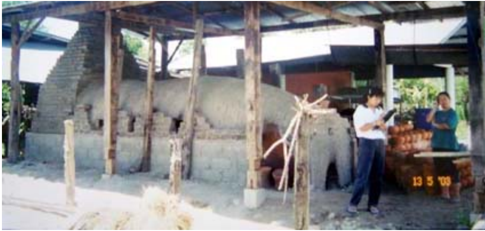
รูปที่ 7 แสดงลักษณะเตาอุโมงค์