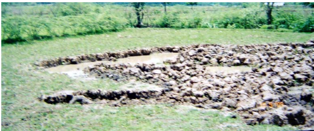
รูปที่ 5 แสดงลักษณะการเปิดหน้าดิน