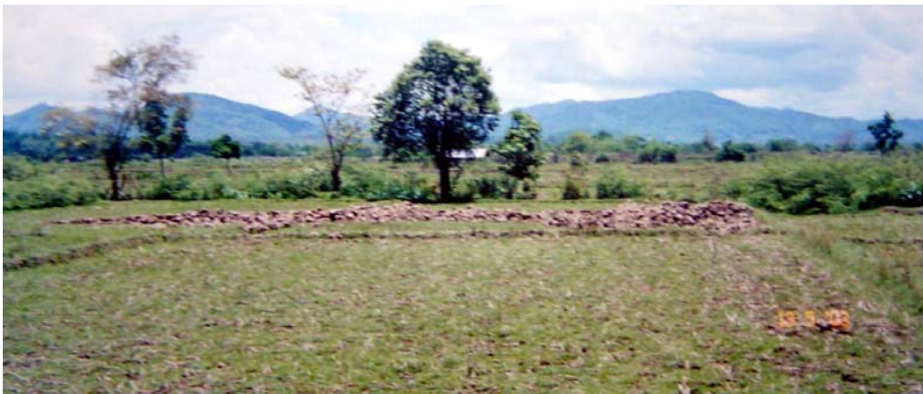
รูปที่ 4 แสดงแหล่งดินสำรวจของหมู่บ้าน

มีการจัดตั้งเป็นกลุ่มหัตถกรรมเครื่องปั้นดินเผาบ้านสันทราย มีสมาชิกประมาณ 20 คน โดยชาวบ้านที่เป็นสมาชิกรวมทุนกันเพื่อจัดตั้งกองทุนของกลุ่มและจัดซื้อที่ดินเปล่าซึ่งเป็นที่ดินท้องนาเนื้อที่ประมาณ 2 ไร่ ดังแสดงในรูปที่ 4 ทำการเปิดหน้าดินประมาณ 10 นิ้ว ดังแสดงในรูปที่ 5 นำเอาดินเหนียวดำชั้นล่างขึ้นมาใช้ ชั้นดินเหนียวดำมีความหนาประมาณ 1-2 เมตร จากนั้นแบ่งขายให้สมาชิกในราคา 175 บาท/เมตรกีดัน เมื่อสมาชิกคนใดหรือครัวเรือนใดผลิตผลิตภัณฑ์ได้มากพอ ก็สามารถนำมาเผาในเตาเผาของหมู่บ้าน โดยเสียค่าใช้จ่ายในการดำเนินการให้แก่ตัวแทนผู้รับผิดชอบของกลุ่ม คือ นายแก้ว นวลอร