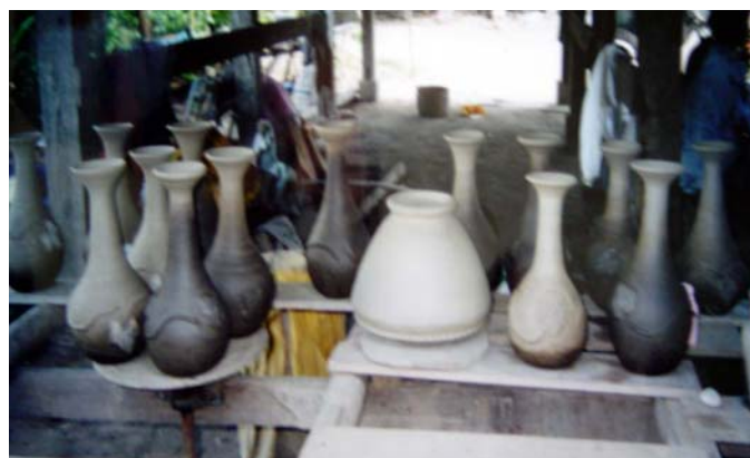
รูปที่ 9 แสดงวิธีการตากแห้งผลิตภัณฑ์