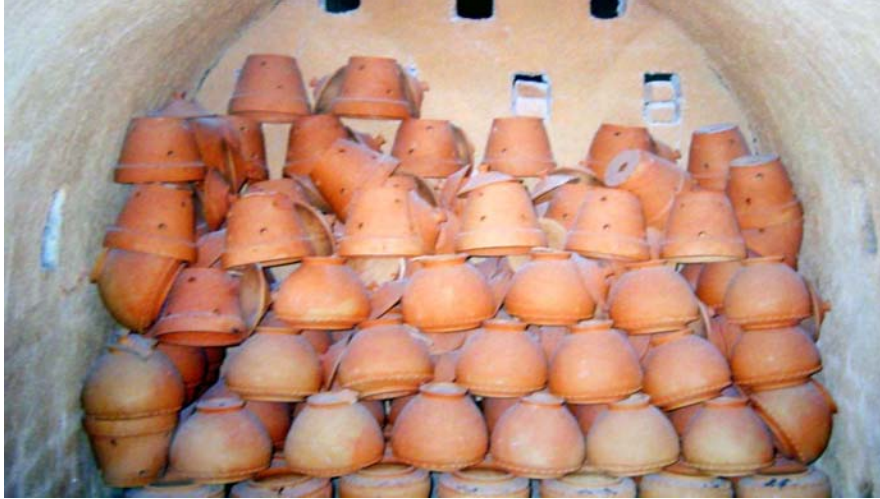
รูปที่ 10 แสดงผลิตภัณฑ์ภายในเตาอุโมงค์ที่เผาแล้ว