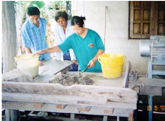
รูปที่ 8 แสดงวิธีการผสมทรายกับดิน