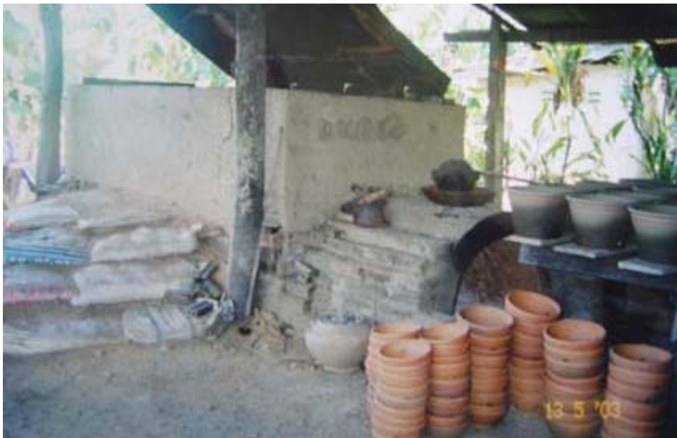
รูปที่ 6 แสดงลักษณะเตาเผาเปิดบน

การประกอบการมีทั้งการรวมกลุ่มกันทำระหว่างครัวเรือนที่เป็นเครือข่ายและการประกอบการเป็นรายบุคคลหรือแต่ละครัวเรือน ครัวเรือนใดที่มีฐานะดีก็มีการสร้างเตาเผาขนาดเล็กเป็นของตนเอง ในหมู่บ้านสันทราย มี 3 ครัวเรือนที่มีเตาเผาเป็นของตนเอง คือ ครัวเรือนของนายก้อน อุดมะ ครัวเรือนของนายแก้ว นวลอร และบ้านตรงข้ามบ้านนายก้อนอีกหนึ่งครัวเรือน ลักษณะของเตาเป็นสี่เหลี่ยมขนาด ประมาณ 2 x 1.5 ตารางเมตร ความสูงของเตาประมาณ 1.5 เมตร เป็นเตาเปิดบนดังแสดงในรูปที่ 4 สำหรับครัวเรือนอื่นที่ไม่มีเตาเผาเป็นของตนเองจะเผาในบริเวณพื้นที่โล่งแล้วสูมเกลบหรือฟางแทน บางครั้งถ้ามีผลิตภัณฑ์จำนวนมากพอก็จะมาใช้เตาของหมู่บ้านซึ่งเป็นเตาอุโมงค์ดังแสดงในรูปที่ 7 โดยเสียค่าใช้จ่ายในการดำเนินการซึ่งจะเป็นค่าฟืนและค่าขนย้าย เตาอุโมงค์มีขนาด กว้าง 2.5 เมตร ยาว 7 เมตร สามารถเผาผลิตภัณฑ์ได้มากกว่าเตาเปิดบนประมาณ 5 เท่า