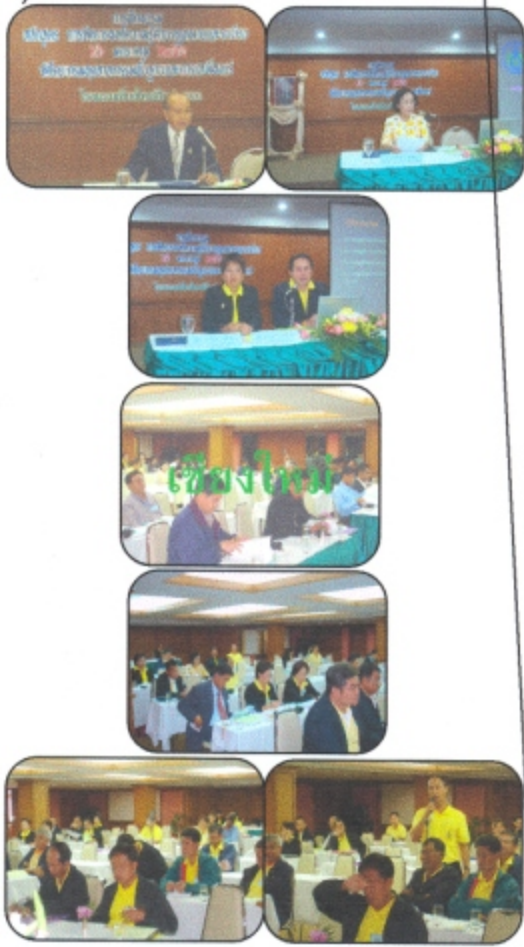
การฝึกอบรม หลักสูตร “การจัดการองค์ความรู้ด้านกฎหมายและระเบียบ” วันที่ 26 มกราคม 2550 ณ โรงแรมเชียงใหม่ฮิลล์ จังหวัดเชียงใหม่