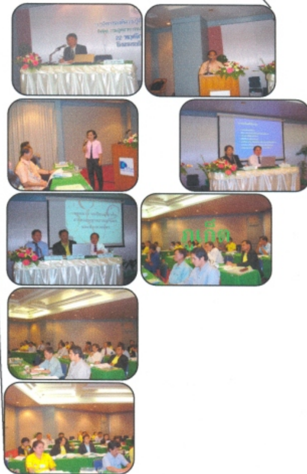
การฝึกอบรม หลักสูตร “การจัดการองค์ความรู้ด้านกฎหมายและระเบียบ” วันที่ 22 พฤศจิกายน 2549 ณ โรงแรมรอยัลภูเก็ต ซิตี้ จังหวัดภูเก็ต