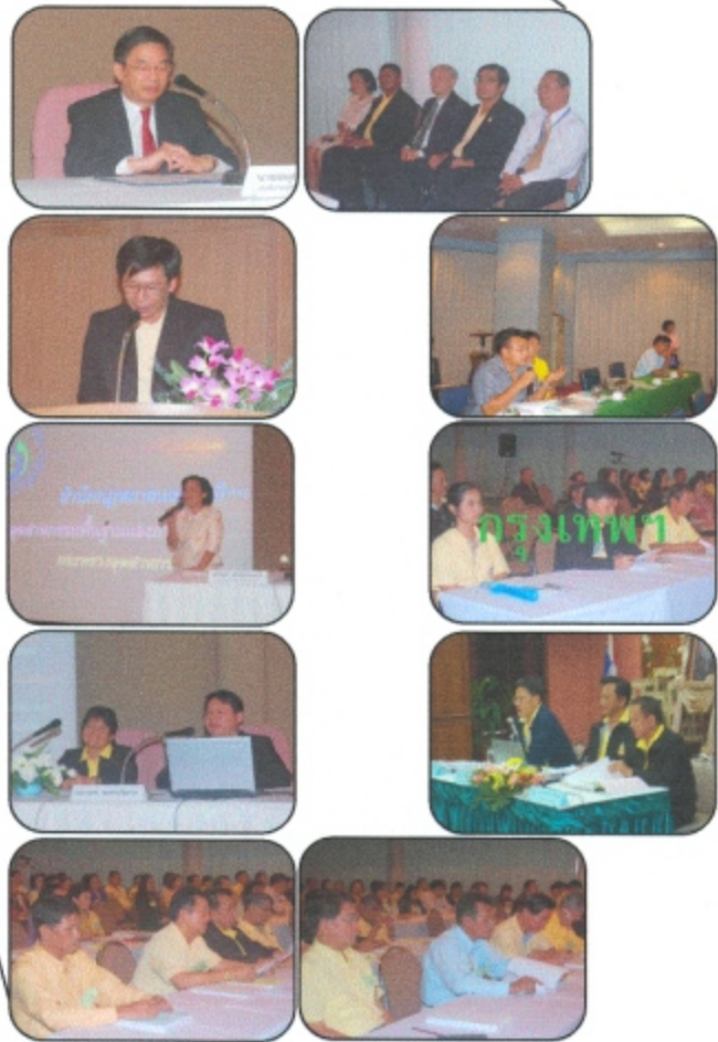
การประชุมสัมมนาเชิงปฏิบัติการ เรื่อง “กลยุทธ์ในการบริหารจัดการทรัพยากรแร่ตามพันธกิจของกรมอุตสาหกรรมพื้นฐานและการเหมืองแร่” ระหว่างวันที่ 16-17 พฤษภาคม 2550 ณ ห้องประชุมใหญ่ กรมอุตสาหกรรมพื้นฐานและการเหมืองแร่ กรุงเทพมหานคร