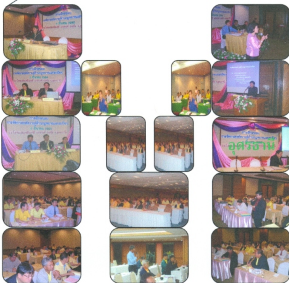
การฝึกอบรม หลักสูตร "การจัดการองค์ความรู้ด้านกฎหมายและระเบียบ" วันที่ 9 มีนาคม 2550 ณ โรงแรมเจริญศรี แกรนด์ รอยัล จังหวัดอุดรธานี